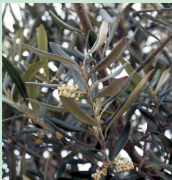
As flores poden ser unisexuais ou hermafroditas, moi pequenas e cos pétalos brancos.