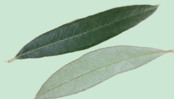
As follas son persistentes e opostas.

Cultívase polo froito e pola madeira, moi valorada para escultura e torno e como combustible. En medicina tradicional as follas usábanse como febrífugas e os froitos son aperitivos e tónicos. A oliveira é unha árbore de gran simboloxía. Por Pascua lévanse ramos de oliveiras a bendecir e gárdanse na casa todo o ano para que dean boa sorte. Tamén se usaban para espartar as meigas.