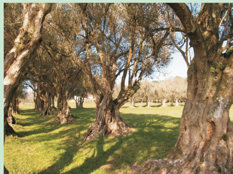
Oliveiras do Pazo de Santa Cruz. Ortiqreira (Vedra-A Coruña). Varias fileiras rodeando os prados onde se poden atopar arredor de 500 exemplares plantados desde comezos do século XVI. Os máis grandes miden 13 m de altura e case 4 m de perímetro troncal.

Debaixo da oliveira non chove nen hai orballo, meniña se has de ser miña non me deas máis traballo.