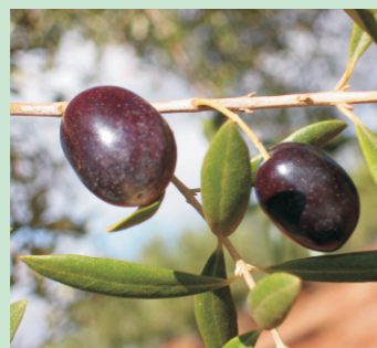
O froito é a oliva, unha drupa de ata 3 cm de lonxitude, de cor negra ao madurar.

Debaixo da oliveira non chove nen hai orballo, meniña se has de ser miña non me deas máis traballo.